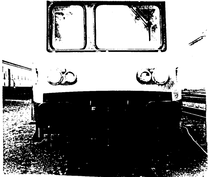
Super détail face avant.